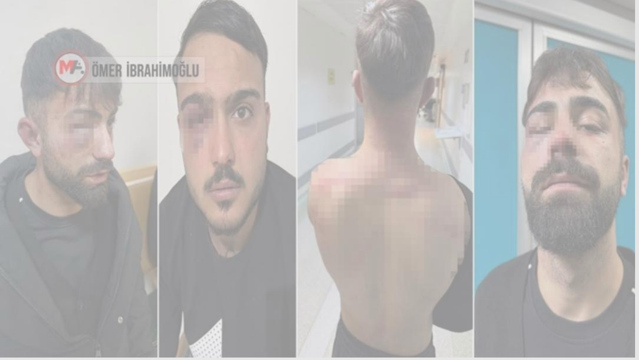
Şekil 2/ Newroz'dan Sonra Gözaltına Alınırken İşkenceye Uğrayan Kişilere Ait Fotoğraf. 3

28 Mart 2026 tarihinde ise operasyonların devamı niteliğinde yeni işlemler gerçekleştirilmiş; daha önce yapılan ev baskınlarında adreslerinde bulunmayan 2 yetişkin yurttaş gözaltına alınarak tutuklanmıştır. Bu durum, sürecin yalnızca belirli günlerle sınırlı kalmayıp, devam eden bir operasyonel süreç şeklinde yürütüldüğünü göstermektedir.