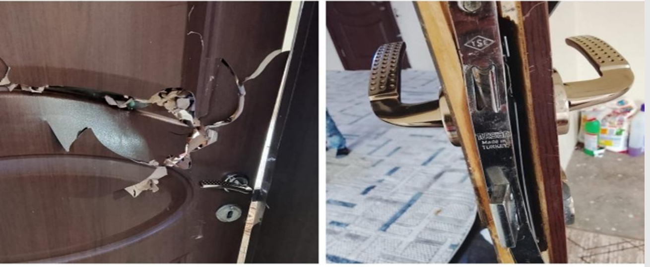
Şekil 3/ Siirt'te Gözaltına Yurttaşın Kapısının Kırıldığını Gösterir Fotoğraf 4

Siirt'te 2026 yılı Newroz süreci kapsamında en az 1 kişinin gözaltına alındığı tespit edilmiştir. Adli kontrolle serbest bırakılmıştır.