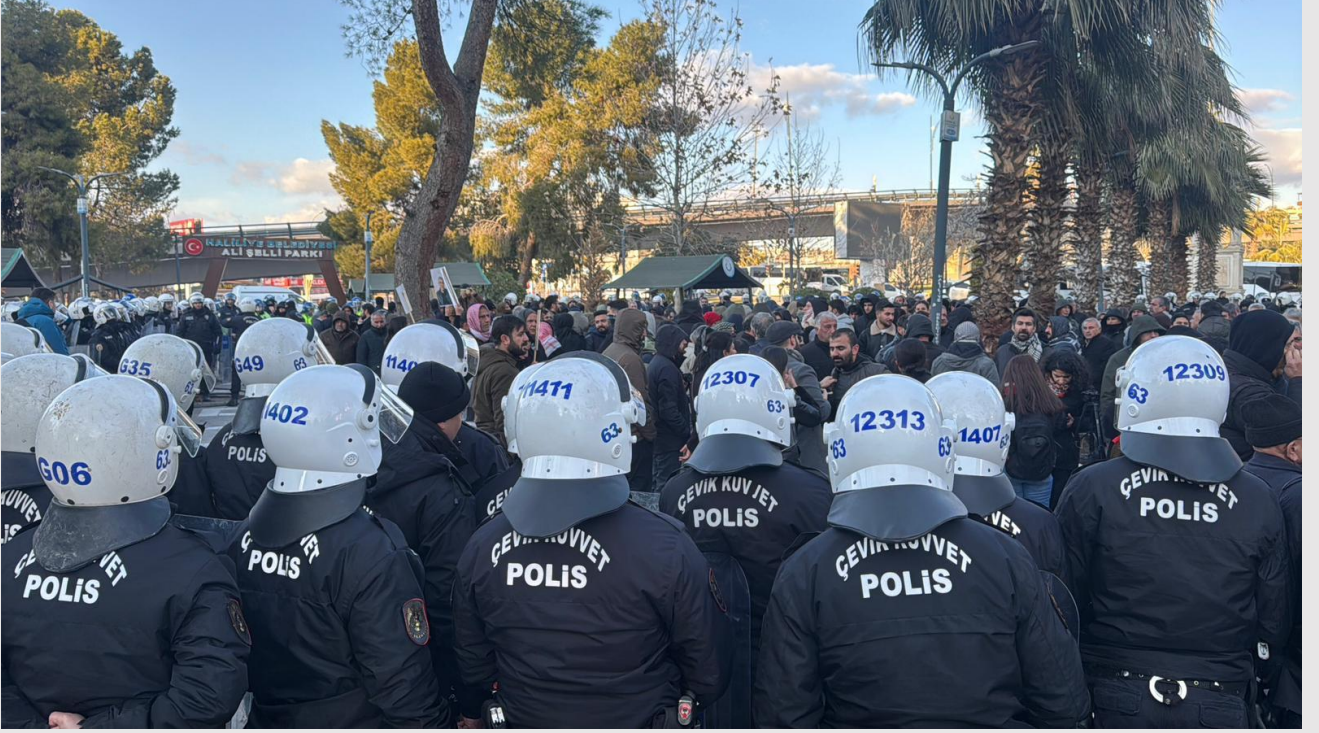
Şekil 5/19 Ocak 2025 Tarihli Yürüyüşte Polisin Yurttaşları Alana Sıkıştırdığı ve Yürütmediğini Gösterir Fotoğraf