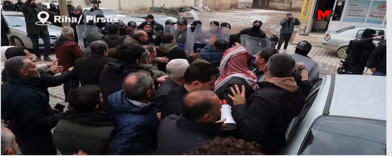
Şekil 3/8 Ocak 2026 Tarihli Suruç'ta düzenlenen eylem sırasında polis ekipleri, kalabalığa kalkanlarla müdahale ederken eylemcilerle polis arasında kısa süreli arbedeyi gösterir fotoğraf. Linkte 0.50/01.40 arasında müdahaleden bir görüntü. 1