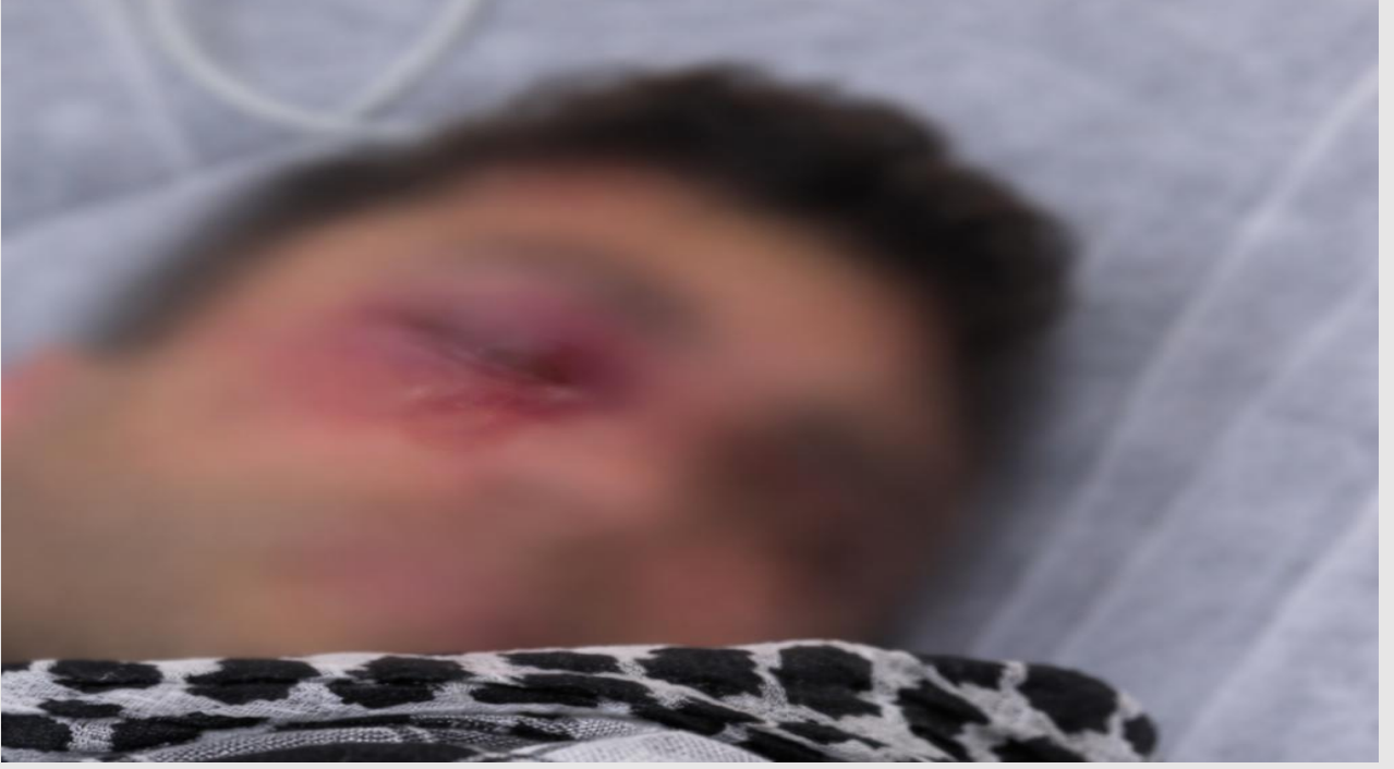
Şekil 1/ Gözünü Kaybetme Tehlikesi Yaşayan Yurttaşın Saldırıdan Sonraki Görüntüsü

22 Ocak 2026 tarihinde Suruç ilçesinde gerçekleştirilen protestoya kolluk kuvvetleri tarafından göz yaşartıcı kimyasal ajan, plastik mermi ve tazyikli su kullanılarak müdahale edilmiştir. Müdahale sırasında biri çocuk olmak üzere 7 kişi gözaltına alınmıştır. Müdahale esnasında bir kişinin yüzüne isabet eden plastik mermi nedeniyle ağır yaralandığı, gözünü kaybetme tehlikesiyle karşı karşıya olduğu bildirilmiştir. Aynı müdahalede protestoyu takip eden bir gazetecinin de yaralandığı aktarılmıştır. Gözaltına alınan 7 kişinin tamamı, sevk edildikleri sulh ceza hâkimlikleri tarafından tutuklanmıştır. Gözaltına alınan kişiler, emniyette kendilerine su ve yemek verilmediğini, darp ve kötü muameleye maruz kaldıklarını aktarmıştır.